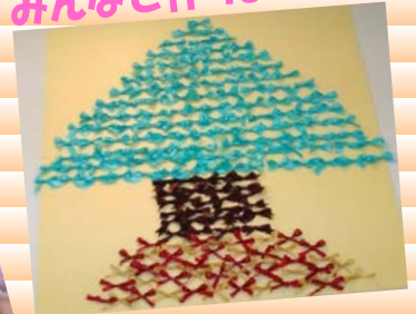
クリスマスツリー♡ みんなで作りました♪♪