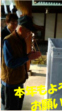
本年もよろしく お願いします!