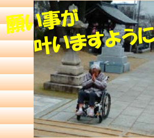
願い事が 叶いますように!!