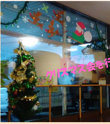
クリスマス会を行いました☆