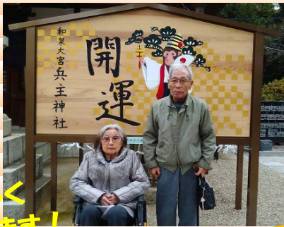
初詣に行ってきました。